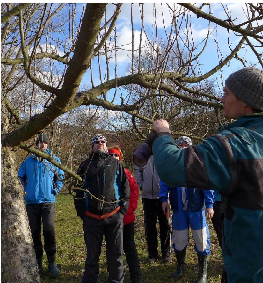
Foto z kurzu řezu ovocných dřevin

Proběhly 3 zimně-jarní víkendové semináře na téma výsadby, množení a řezu ovocných stromů, s praktickými ukázkami řezu dřevin a podzimní workshop na téma péče o ovocný sad. Veřejnost měla příležitost poznat jedinečnost solitérních dřevin i sadů v krajině při vycházce s potulným sadařem . Uspořádali jsme i exkurzi ke zpracovatelům ovoce .