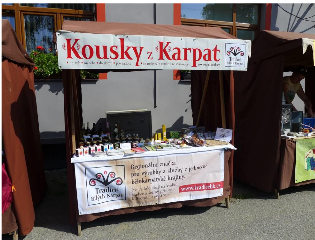
Prezentace výrobků se značkou Tradice Bílých Karpat.

Obraz krajiny Bílých Karpat dotvářejí místní výrobky. Vznikají díky práci zdejších zemědělců, řemeslníků či firem a v řadě případů jsou odkazem na místní krajinu, tradice a dovednosti. Regionální ochranná značka Tradice Bílých Karpat® je jednou z možností, jak místní bělokarpatské produkty zviditelnit. Jedná se o první přeshraniční regionální značku, kterou jsou označovány výrobky jak na moravské, tak na slovenské straně Chráněné krajinné oblasti Bílé-Biele Karpaty, které jsou jedinečné ve vztahu k Bílým-Bielým Karpatům, vyrobené tradičními technologiemi, s podílem ruční práce, z místních surovin, jsou kvalitní a šetrné vůči životnímu prostředí.