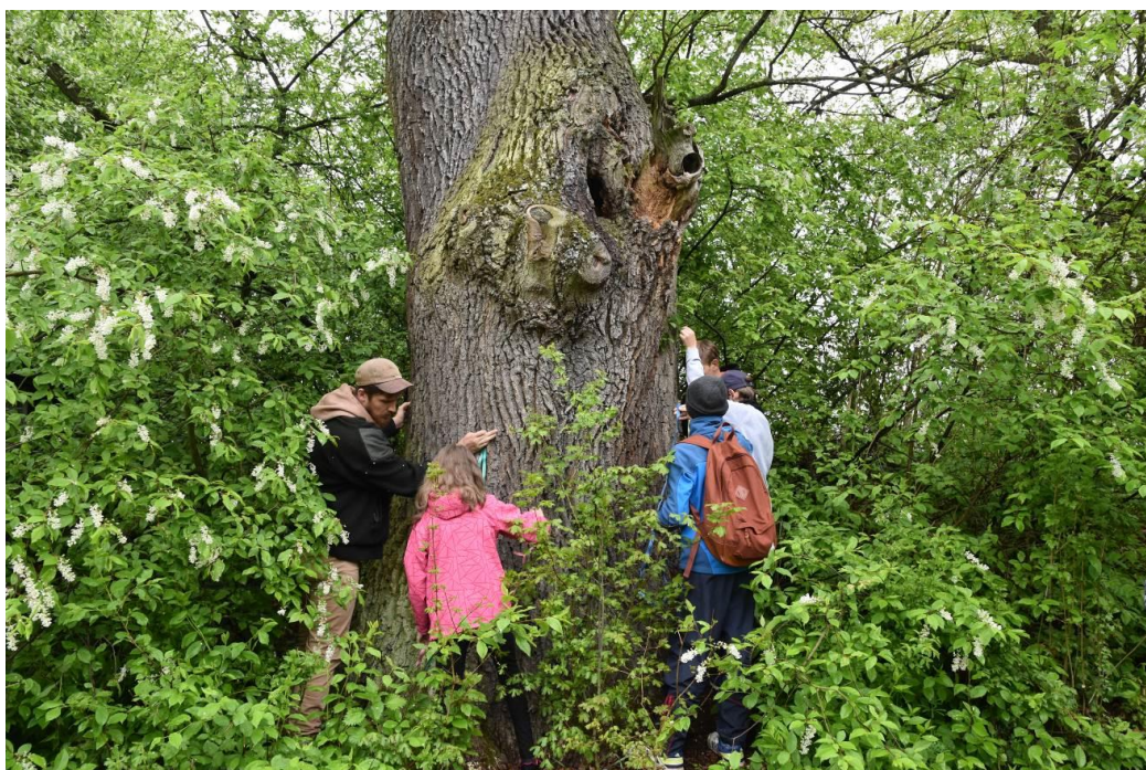
Jedna z aktivit Doupných stromů – měření obvodu stromu.