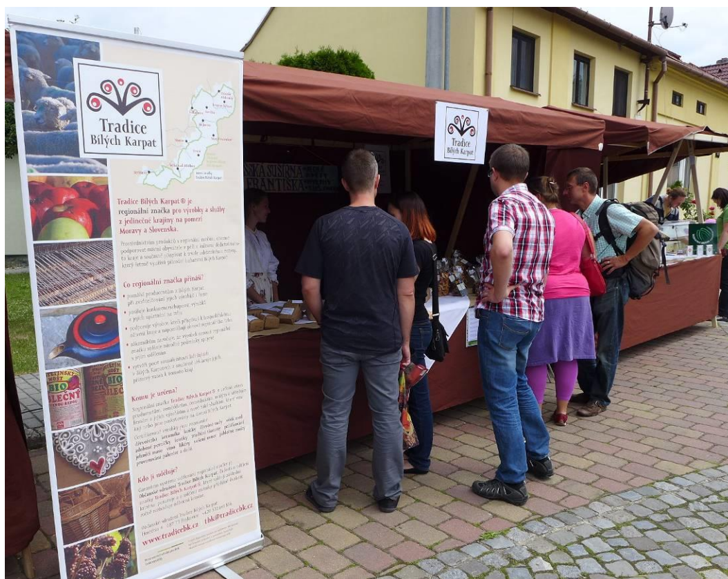
Jarmark držitelů značky TBK

Na přípravě slavnosti, kterou pořádají Tradice Bílých Karpat, Centrum Veronica Hostětín a Obec Hostětín, se podílela více než desítka partnerských organizací. Jedinečná je i každoroční a osvědčená spolupráce s dobrovolníky, kteří přispívají ke zdárnému průběhu slavnosti. Letos přijelo pomáhat kolem stovky dobrovolníků.